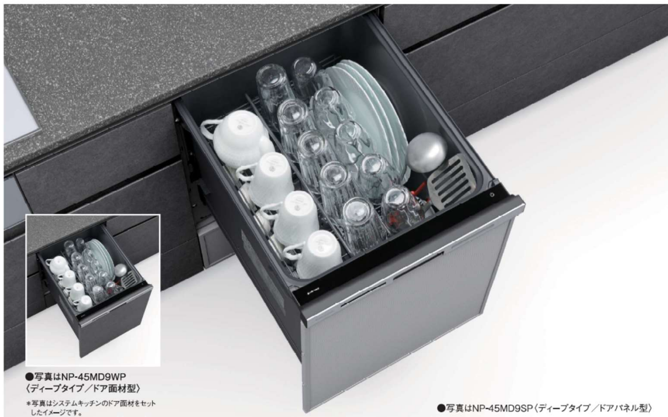
●写真はNP-45MD9WP <ディープタイプ/ドア面材型>

★市販の食器洗い機専用液体洗剤がご使用いただけます。但し、高粘度の洗剤は、液体洗剤自動投入ではご使用いただけません。