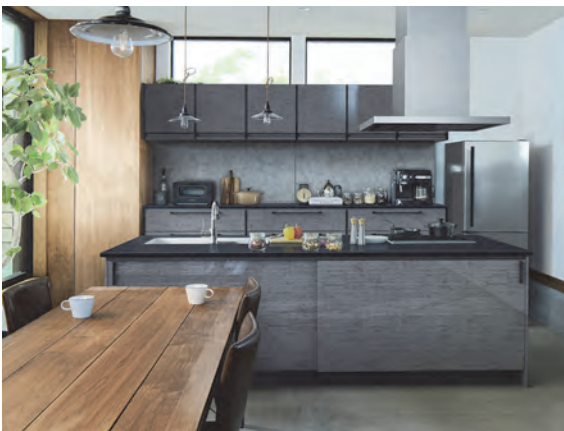
コンクリートグレー