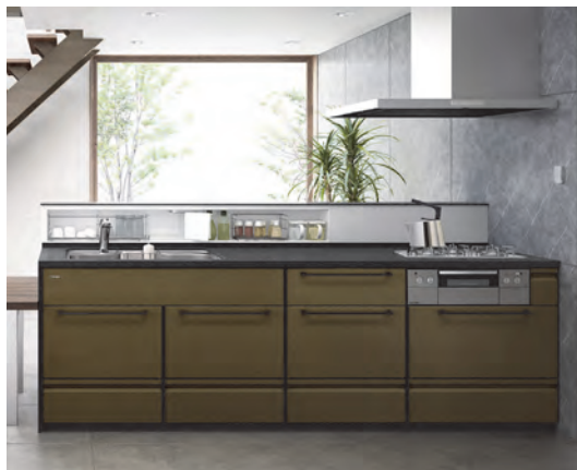
アンティークブロンズ